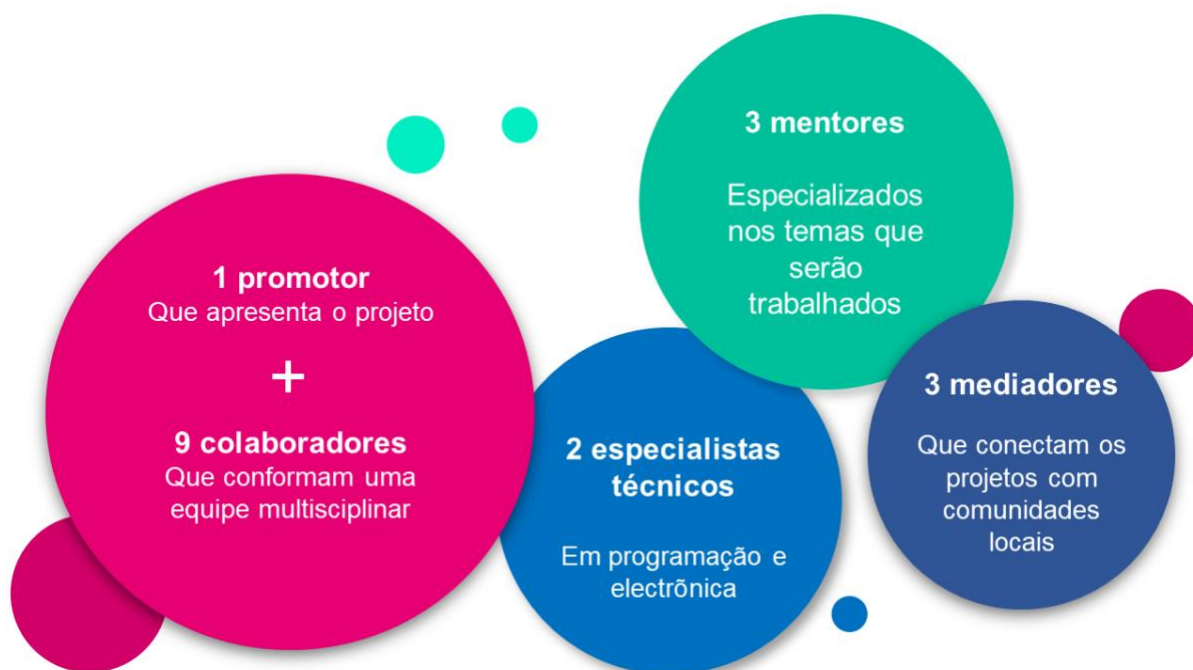
Imagem 1. Um promotor mais 9 colaboradores, 3 mentores, 2 especialistas técnicos, e 3 mediadores locais.